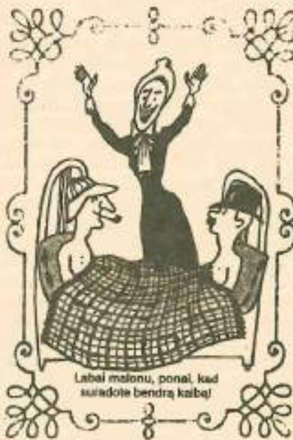
Labai maionu, ponai, kad susidote bendrą kalbą!

dėtis ir vadinamieji moraliniai išskaičiavimai. Santuoka - tai loterija, kurioje daugiau šansų pralaimėti, nei laimėti. Akivaizdu, jog žmogaus prigimties biseksualumas (hermafroditizmas) atspindėjo gražioje filosofinėje alegorijoje apie dvi kadais vientiso organizmo puseles, ieškančias viena kitos. Bet kokia menka tikimybė surasti savąją „puselę“ tarp milijardų asmenų. Meilė kupina atsitiktinumų: atsitiktinai dviese susitinka, atsitiktinai susipažįsta, atsitiktinai įsimyli. Vėliau ant lakaus atsitiktinumų smėlio stengiasi pastatyti savo laimės ir gerovės