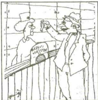
- Štai, pasigėrėkite. Tik tris kartus naudotas ir jau kiuras! O parašyta: "Goden do 1992 goda..."

Gerbiamieji skaitytojai! Humoristinio rašinio, piešinio ir fotonuotraukos konkursas tęsiasi! Tai buvo ne balandžio 1-osios pokštas. Primename, kad premijas gausite ne rubliais, net ir ne doleriais, o kur kas rimtesne "valiuta" -PREZERVATYVAIS! Laukiame Jūsų darbų iki rugsėjo 1-os dienos.