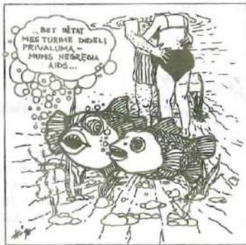
Visi piešiniai - Algimanto Kriščiūno