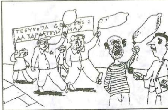
- Šituos balionus pirkome vaistinėje...

Gerbiamieji skaitytojai! Humoristinio rašinio, piešinio ir fotonuotraukos konkursas tęsiasi! Tai buvo ne balandžio 1-osios pokštas. Primename, kad premijas gausite ne rubliais, net ir ne doleriais, o kur kas rimtesne "valiuta" -PREZERVATYVAIS! Laukiame Jūsų darbų iki rugsėjo 1-os dienos.