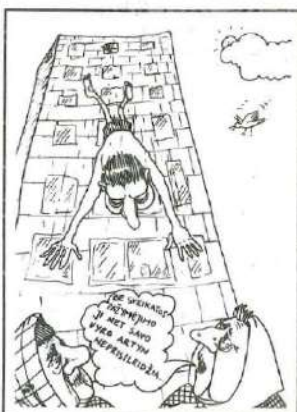
A. Kriščiūno pieš.

43% vyrų ir tik 21% moterų norėtų užsiiminėti meile dažniau negu dabar. 45% moterų ir 35% vyrų gali taikytis su laikina partnerių neištikimybė šeimos išsaugojimo vardu.