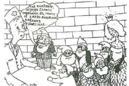
Algimanto Kriščiūno papeckiojimai...