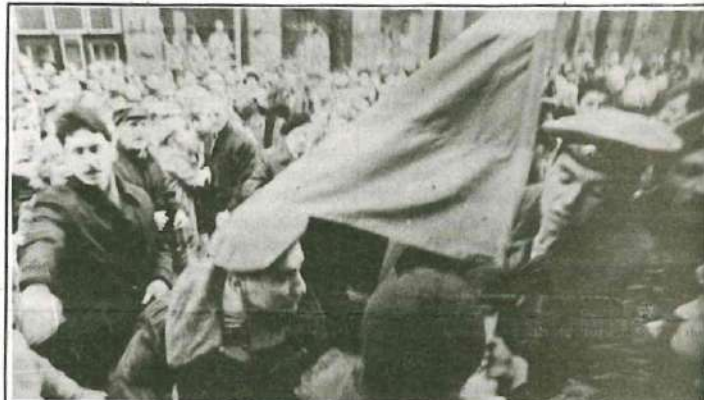
Vilnius, Lapkričio 7-toji. Šie vyrukai visada vartoja kontraceptines priemones.

Šauniamajam Spaliui - mūsų mintys ir darbai!